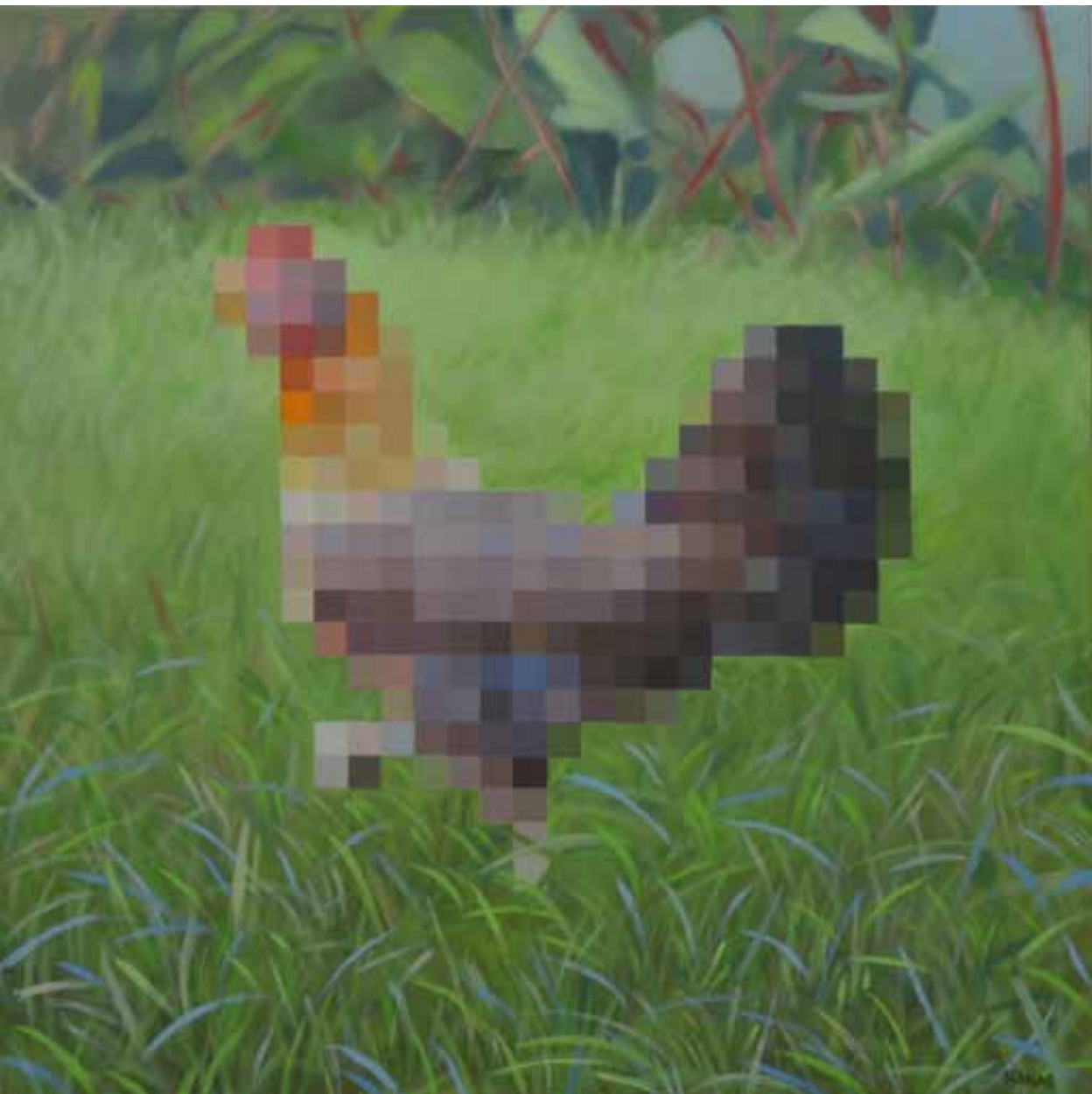
Chicken, 2016 Oli s/tela 50 x 50 cm