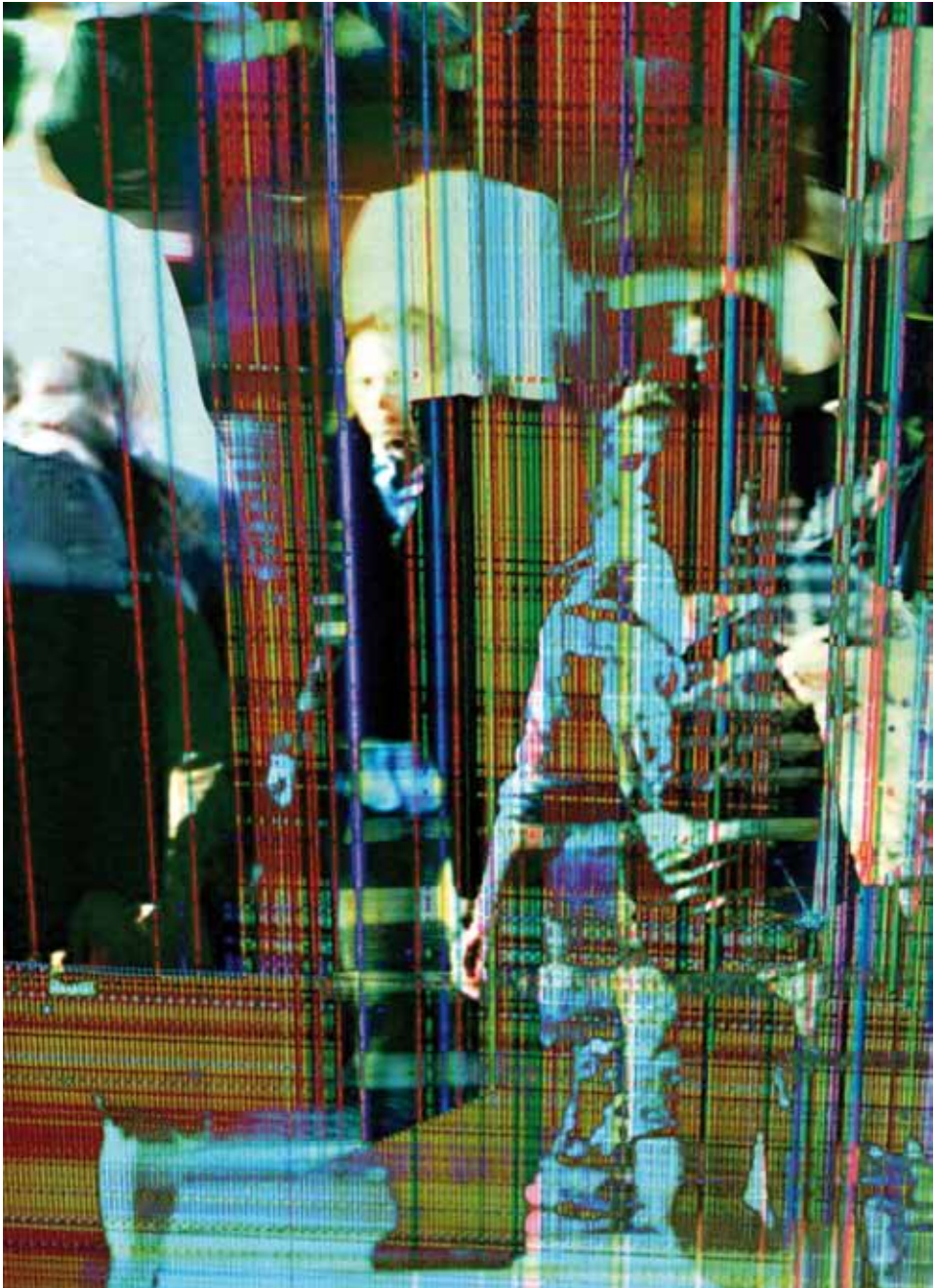
Transiciones IV , 2016 Impressió digital 100 x 150 cm